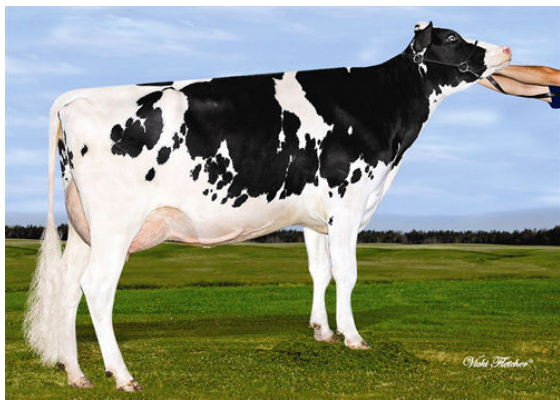
LAMPARDIS MEDIUM DENSITY