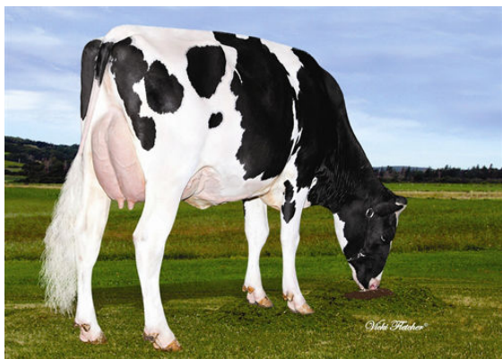
DEUX RIVIERES DENSITY MOLLY