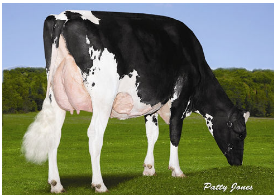
PETHERTON DENSITY RATZ